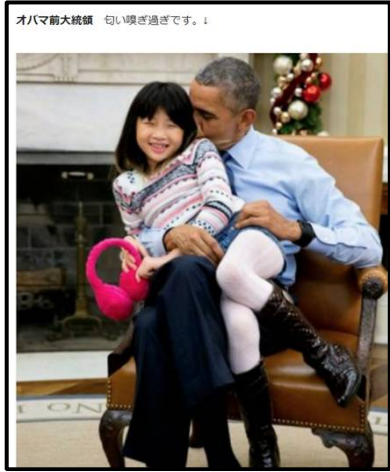
オバマ前大統領 匂い嗅ぎ過ぎです。↓

世界では30秒に1人、子供が売買されていて600万人の子供達が被害に遭っています。 米国では社会問題の一つに児童の行方不明事件がありますがその人数は年間80万人、1日に約2,000人も行方不明になっています。 今一番、急成長犯罪産業が人身売買で労働、性的、臓器売買、アドレノクロム抽出、悪魔崇拜儀式の為に 16兆円産業 と言われ性的人身売買だけでも 6兆円産業 と言われています。 ドラッグ、銃売買より全然お金になる違法売買なのです。 その為、大規模な犯罪組織が存在しています。