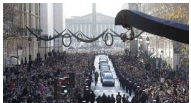
コンコルド広場からマドレーヌ寺院に進む ジョニー・アリディの葬列

https://www.youtube.com/watch?v=nBoUwC-Ab5M