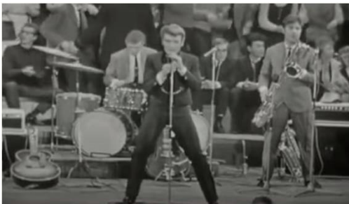
JOHNNY HALLYDAY la bagarre live amsterdam 1963

葬儀は国葬級で、集まったファンの数は数十万人、寺院前でマクロン大統領が弔辞を述べた。