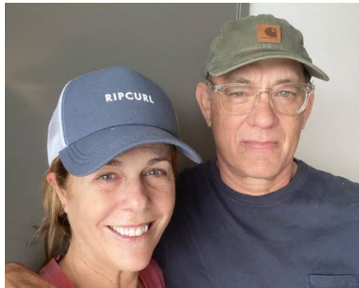
2021年3月 『ウォール・ストリート・ジャーナル』紙に寄稿した時の写真

https://spur.hpplus.jp/culture/celebritynews/202103/22/KQd3mXY/